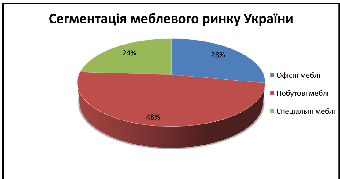
Рис.1 Сегментація меблевого ринку України

Аналізуючи структуру меблевого ринку України, то на офісні меблі припадає 28% усієї виробленої продукції. (Рис.1)[5]