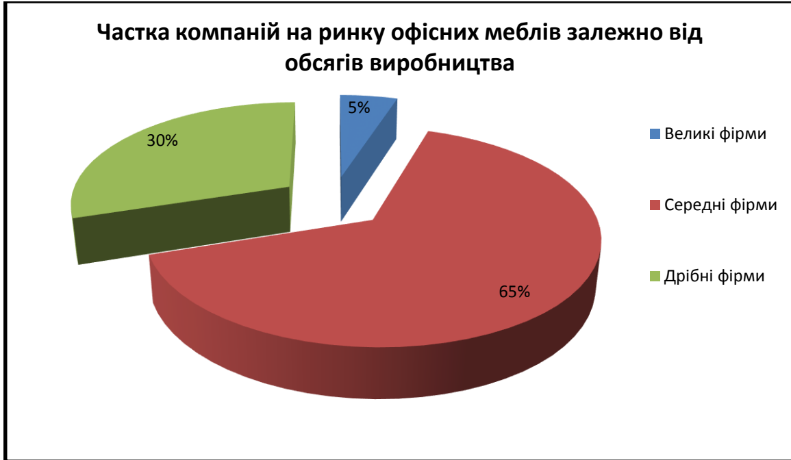
Рис.3 Частка компаній на ринку офісних меблів залежно від обсягів виробництва

На ринку офісних меблів України працюють компанії, обсяг виробництва яких дозволяє класифікувати їх на групи. Частка великих компаній становлять 5%, середніх – 65%, дрібних – 30%.(Рис.3)[4]