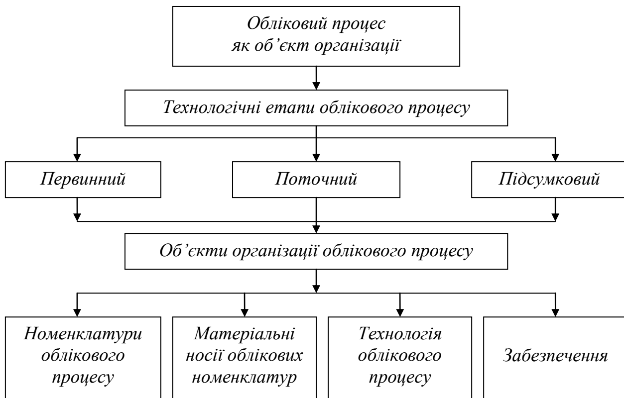
Рис. 2. Об'єкти організації облікового процесу

На кожному етапі основні об'єкти організації облікового процесу такі: 1) облікові номенклатури; 2) носії облікових номенклатур; 3) рух носіїв; 4) технологія облікового процесу забезпечення останнього. Обліковий процес як організаційну сукупність подано на рис. 2.