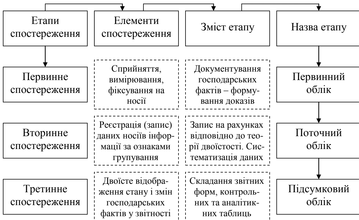
Рис. 1. Характеристика поетапної побудови бухгалтерського обліку як технологічного процесу та об'єкта організації

При організації технології облікового процесу слід відрізнити технологічні прийоми, які відображують обробку інформації, від методологічних правил, що визначають метод обліку. Це дуже важливо в разі застосування ЕОМ (персональних комп'ютерів), коли значну частку облікових робіт здатна виконати машина (табл. 1).