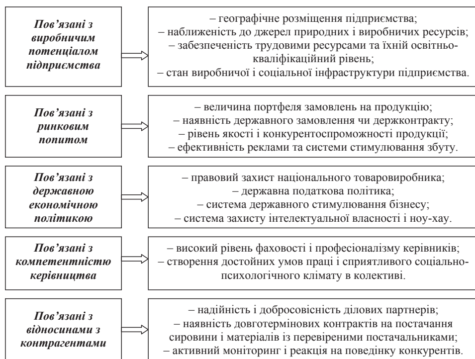
Рис. 2. Структуруючі елементи механізму забезпечення фінансово-економічної безпеки підприємства

г) загроза виявлена системою економічної безпеки підприємства, але заходи з нейтралізації негативних наслідків загроз, реалізовані менеджерами з безпеки, є неефективними і не приносять очікуваних позитивних результатів.