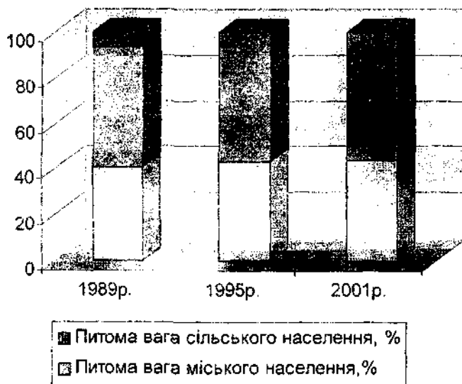
Мал.1. Структура населення Тернопільської області за місцем проживання

10570 дітей, а померло 15721 чол, отже природне скорочення населення становило 5151 чол., (10570-15721=-5151 чол.). У міських поселеннях народилось 4403 дитини, померло 4549 чол., природне скорочення дорівнює 146 чол., в сільській місцевості народилось 6167 дітей, померло 11172 чол., природне скорочення 5005 чол. Таким чином, природне скорочення населення області зумовлене переважно ситуацією, яка склалась у сільській місцевості.