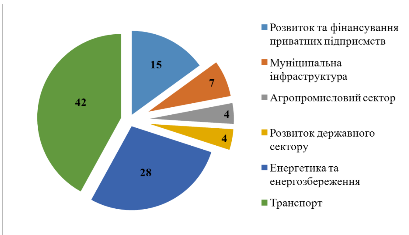
Графік 4.2 Структура проектного портфеля Світового банку в Україні

Станом на лютий 2013 року портфель проектів Світового банку складається з 10 інвестиційних проектів в активній стадії реалізації на суму 2.042 млрд. доларів США.