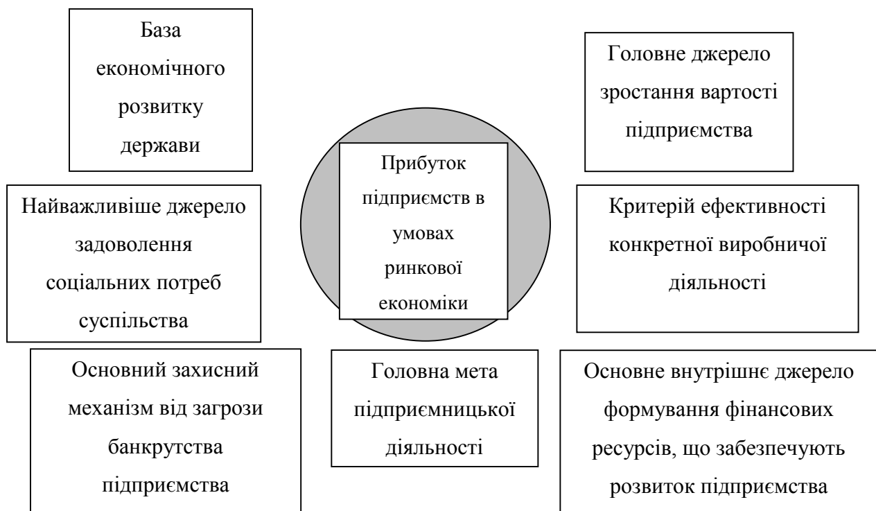
Рисунок 1. Роль прибутку на підприємстві

В умовах ринкової економіки на підприємствах прибуток відіграє значну роль, яка проявляється в наступному (рис.1).