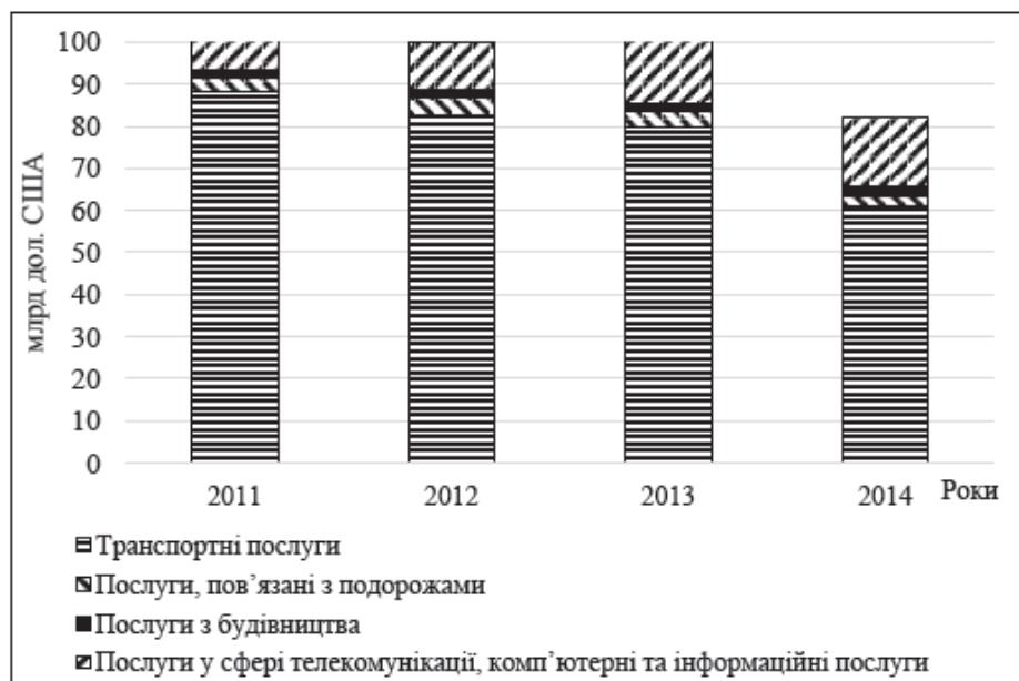
Рис. 2. Видова структура експорту послуг України у 2011–2014 рр., млрд дол. США

Не менш важливим аспектом аналізу зовнішньої торгівлі послугами є дослідження секторальної структури експорту послуг. За даними рисунка 2, найбільш вагомим сегментом українського ринку послуг у 2011–2014 рр., призначених для експорту закордон, є транспортні послуги, що пов'язані з доставкою товару до митного кордону держави-імпортеру та пункту призначення вантажів, перевезення пасажирів усіма видами транспорту, забезпечення функціонування транспортної інфраструктури, транспортування по трубопроводах газу, аміаку, нафти, електроенергії [3, с. 65].