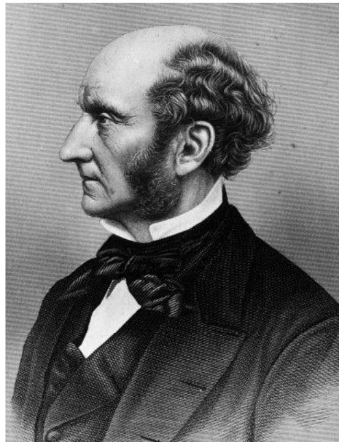
Джон Стюарт МІЛЛ (1806–1873)

Виклад основного матеріалу дослідження з обґрунтуванням отриманих наукових результатів. Емпіризм Джона Стюарта Мілла має цікаві відмінності від емпіризму найбільш