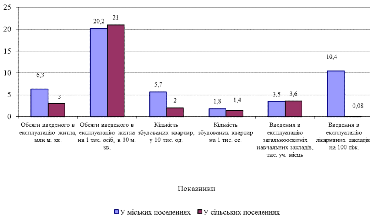
Рис. 1. Порівняння основних характеристик розвитку будівництва у міських та сільських поселеннях регіонів України у 2011 р. (складено за [1, с.220-222])

квартир, коли в загальному обсязі цей показник у міських поселеннях був істотно більшим (у 2,9 рази), а в розрахунку на 1 тис. осіб вищим лише на 28,6 %.