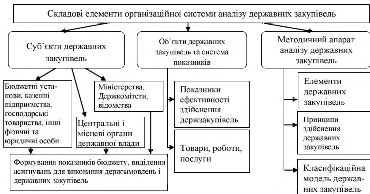
Рис. 1 Складові елементи організаційної системи аналізу державних закупівель

поставки, строк поставки (виконання), графік платежів та умови розрахунків, функціональні характеристики тощо.