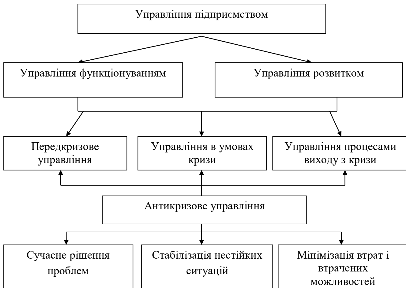
Рис. 1. Складові антикризового управління

Неоднозначність теоретичних положень та недостатність відповідних практичних розробок в сфері діагностики фінансово-господарської діяльності підприємств вказують на потребу у системному дослідженні цієї проблеми.