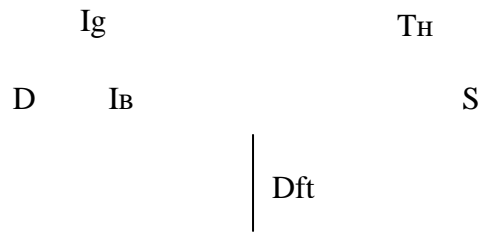
Рис. 1. Відкрита модель народного господарства з впливом держави [2;30]

P – сектор підприємств, H – сектор домашніх господарств, G – сектор державного управління, \Delta V – сектор фінансових установ, Yf – чистий суспільний продукт, C – споживчі витрати домогосподарств, S – заощадження, D – амортизаційні відрахування, I B – валові інвестиції, Tr – трансферти домашнім господарствам, T H – податки домогосподарств, T p – податки підприємств, I g – державні інвестиції, D ft – дефіцит (профіцит) державного бюджету.