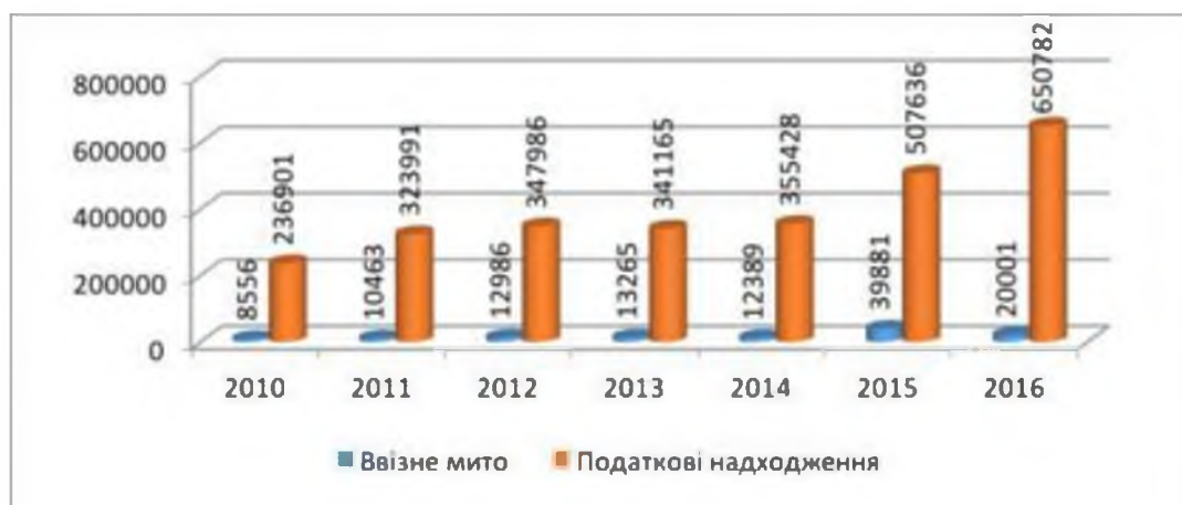
Рис. 1. Фіскальні результати діяльності Митних органів України

Дослідження в сфері оподаткування ЗЕД є надзвичайно важливими, адже в останні роки фіскальна значимість саме митних органів постійно зростає (рис. 1).