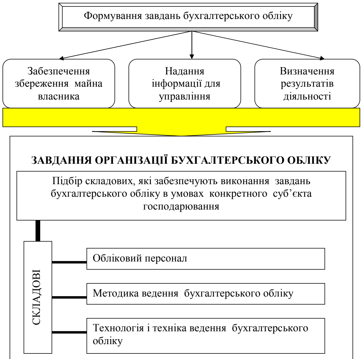
Рис. 2 Завдання організації бухгалтерського обліку [1, с.74]

Виконання завдань організації бухгалтерського обліку з урахуванням особливостей діяльності суб'єкта господарювання забезпечить своєчасне, повне, достовірне та безперервне відображення всіх господарських операцій, здійснених на підприємстві; обробку даних за допомогою відповідних процедур, прийомів і способів відповідно до вихідної інформації; складання на основі отриманого масиву інформаційних даних, зафіксованих у первинних документах, облікових реєстрів і бухгалтерської звітності та своєчасне її надання зацікавленим користувачам.