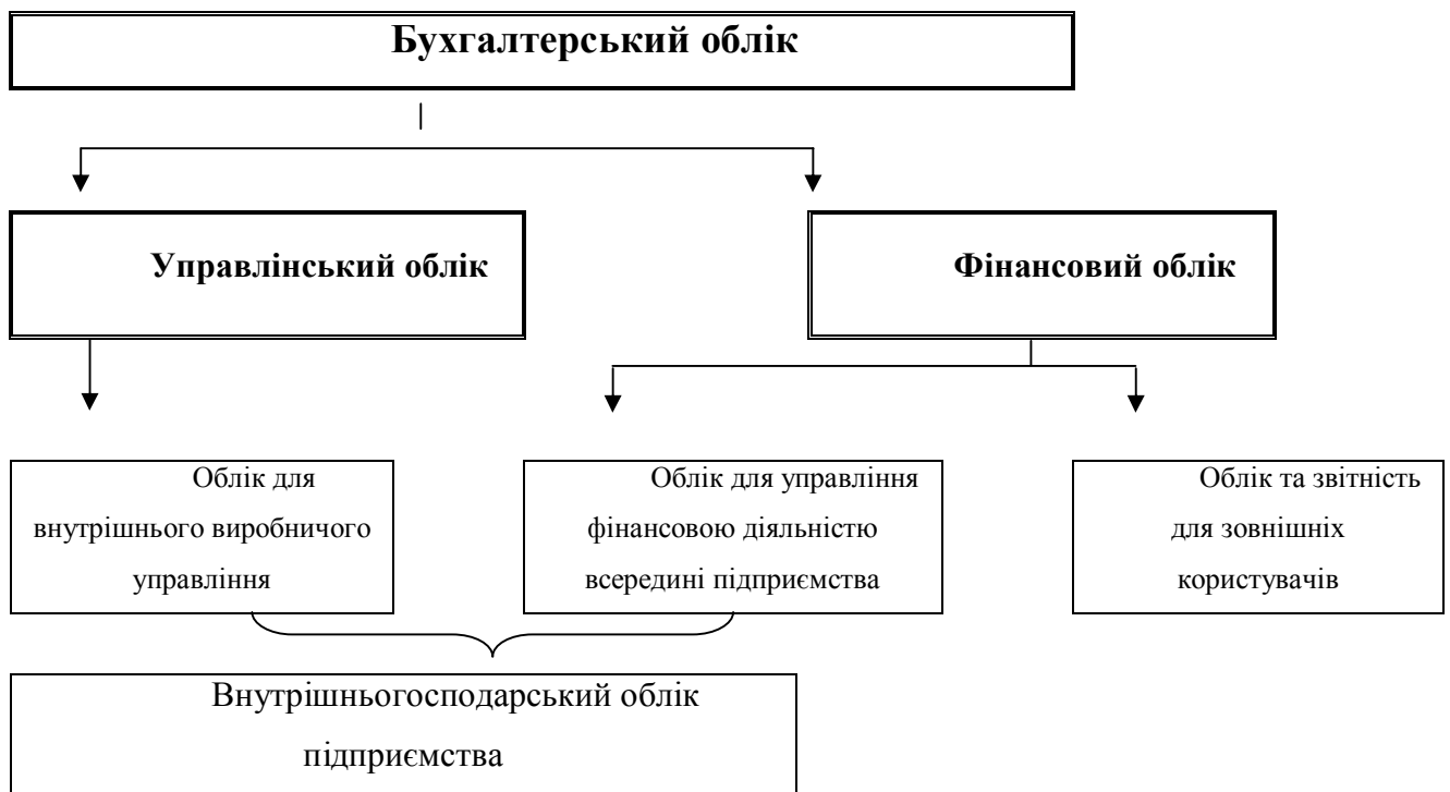
Рис.4. Структура бухгалтерського обліку

Управлінський (внутрішньогосподарський) облік ведеться виключно для внутрішніх інформаційних потреб підприємства. Ведення управлінського обліку не є обов'язковим, його параметри, напрями, глибина не регламентуються, а визначаються підприємством самостійно.