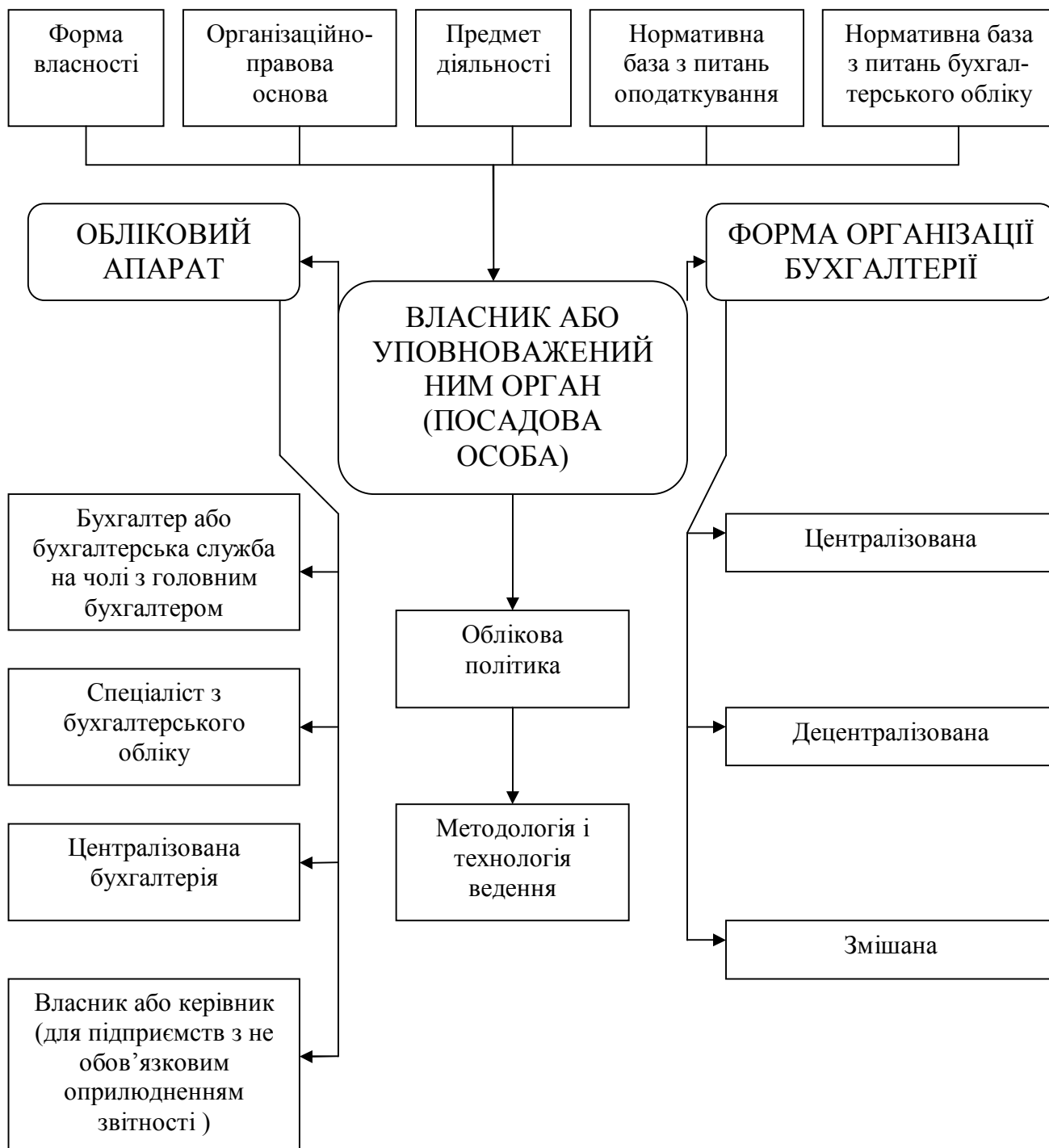
Рис. 1. Організація бухгалтерського обліку на підприємстві

—визначення характеру й обсягу інформації необхідної для обґрунтування оперативних, тактичних і стратегічних рішень.