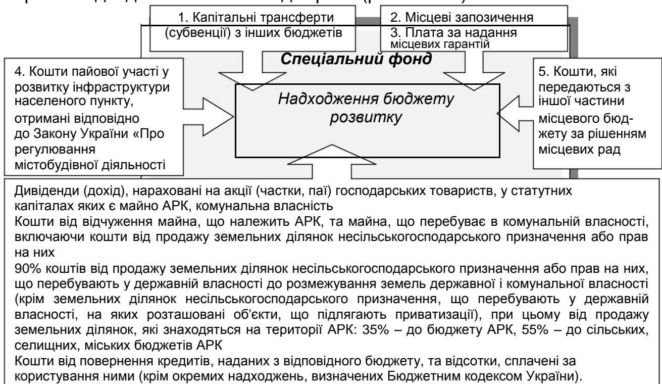
Рис. 1.11.1. Джерела надходжень бюджету розвитку місцевих бюджетів України

Відповідно до чинного Бюджетного кодексу України бюджет розвитку є складовою спеціального фонду місцевого бюджету і його перелік надходжень містить 10 джерел 2 (рис. 1.11.1).