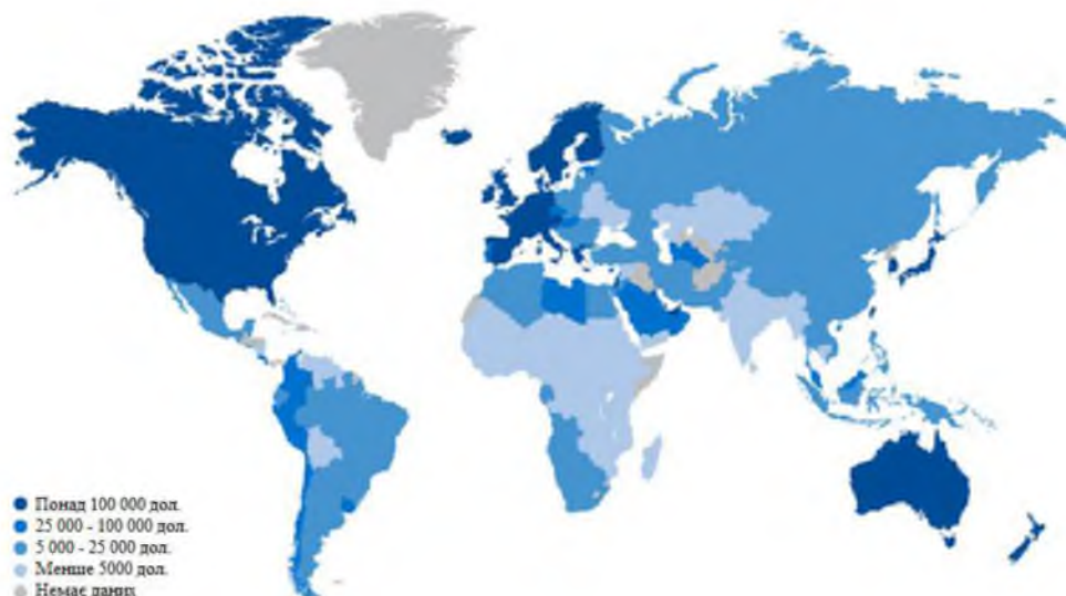
Рис. 1. Картохема рівня добробуту населення планети за показником ВВП на 1 особу у 2016 р., дол. США

Згідно досліджень Дослідницького інституту швейцарської фінансової групи Credit Suisse [5], Україна належить до групи країн з дуже низьким ВВП на душу населення (див. рис. 1).