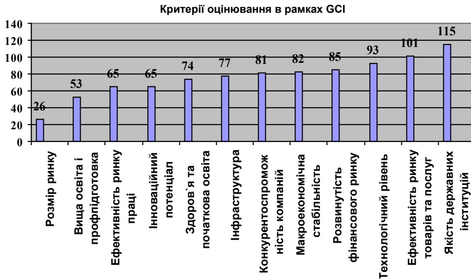
Рис. 2. Рейтинги України у розрізі складових конкурентоспроможності за 2007 рік*

* Побудовано з використанням Звіту СЕФ. Global Competitiveness Index (GCI), 2007 – 2008, Ranks. Page 3. www.cesifo-group.de