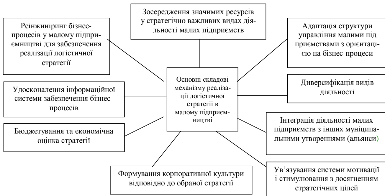
Рис. 1. Механізми реалізації логістичної стратегії в малому підприємстві муніципальних утворень.

Як відомо, у процесі господарської діяльності малі підприємства взаємодіють із різними суб'єктами ринкової інфраструктури, що забезпечують їх тими чи іншими ресурсами або надають послуги, зокрема з постачальниками техніки, обладнання, логістичними центрами і складськими комплексами, страховими, лізинговими, фінансовими компаніями, банками. Логістичний підхід дає змогу розробити чітку й однозначну стратегію досягнення головної мети і визначити ефективність функціонування кожного суб'єкта в системі малого підприємництва відповідно до обраної стратегії [2, 27]. Основні труднощі полягають в узгодженні локальних цілей і завдань окремого малого підприємства з глобальнішою метою муніципальних органів управління. Крім того, треба брати до уваги, що в кожній ланці логістичної системи діють і трансформуються певні ринкові відносини, які можна розподілити на кооперацію, конфлікти та конкуренцію [8].