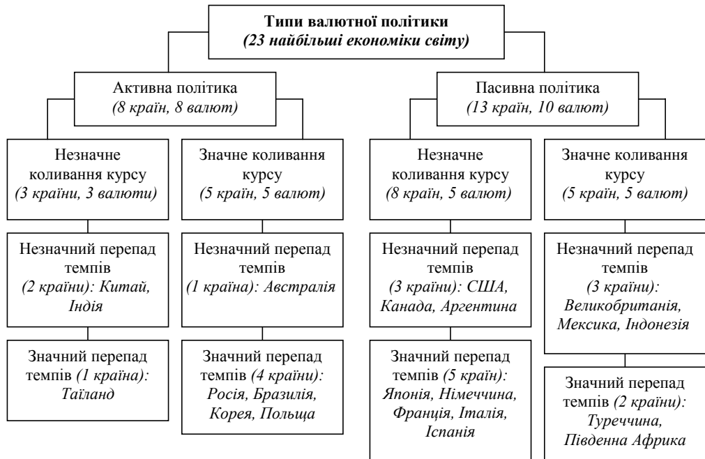
Рис. 1. Типи валютно-курсової політики з урахуванням волатильності валютних курсів і динаміки темпів промислового виробництва [12, 37]