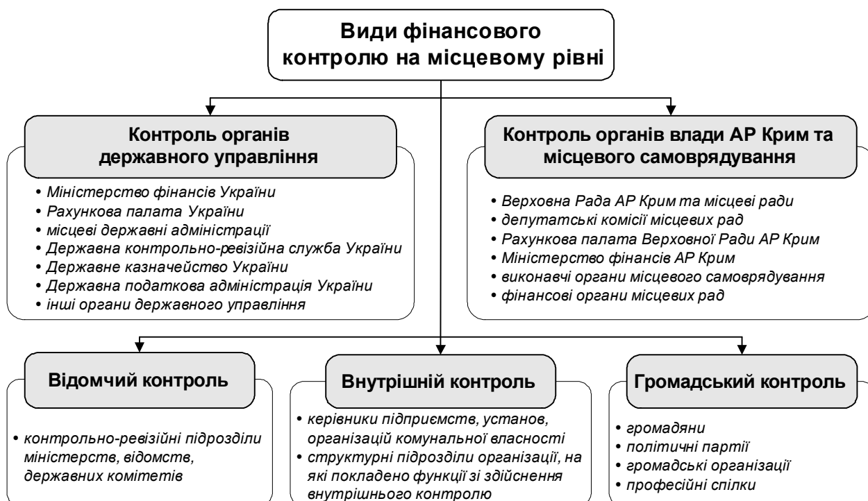
Рис. 1. Види фінансового контролю на місцевому рівні залежно від суб'єктів контролю

Контрольними повноваженнями у сфері місцевих фінансів наділені різні державні та громадські інститути. Особливістю фінансового контролю на місцевому рівні є участь великої кількості суб'єктів, залежно від яких, його поділяють на контроль органів державного управління, органів влади АР Крим та місцевого самоврядування, відомчий, внутрішній та громадський контроль (рис. 1).