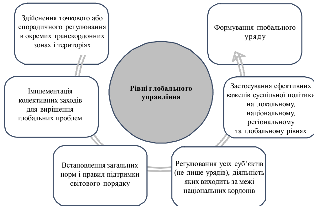
Рис. 1. Рівні глобального управління

Варто зауважити, що існують різні погляди не лише щодо трактування, а й визначення завдань глобального управління – починаючи від вирішення спорадичних локальних проблем економічного розвитку і закінчуючи всеохоплюючим контролем міжнародних відносин, який би здійснювався через глобальний уряд. На основі їх систематизації можна виокремити шість рівнів глобального управління (рис.1).