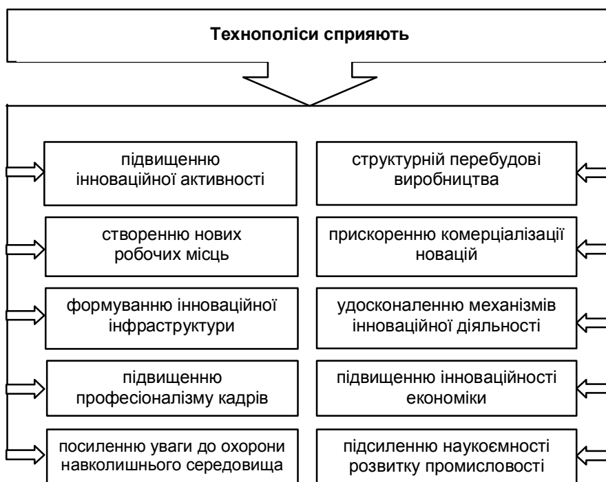
Рис. 3. Вплив технополісів на розвиток регіону

Отже, у країнах з розвинутою економікою відбувається масовий перехід до наукомістких технологій; усвідомлення обмеженості природних ресурсів зумовило пошук ресурсозберігаючих технологій при глибокій переробці сировини. Результатом цього є створення структур, здатних до синтезу науки та виробництва, розвитку індустрії інтелектуальних продуктів. Одним із найефективніших підходів до розв'язання названих завдань є організація мережі технополісів. Технополіси можуть виникати як на базі новоутворених міст, так і на базі старих, реконструйованих. Створення технополісів справляє формуючий вплив на розвиток тих регіонів, де вони розташовані (рис. 3).