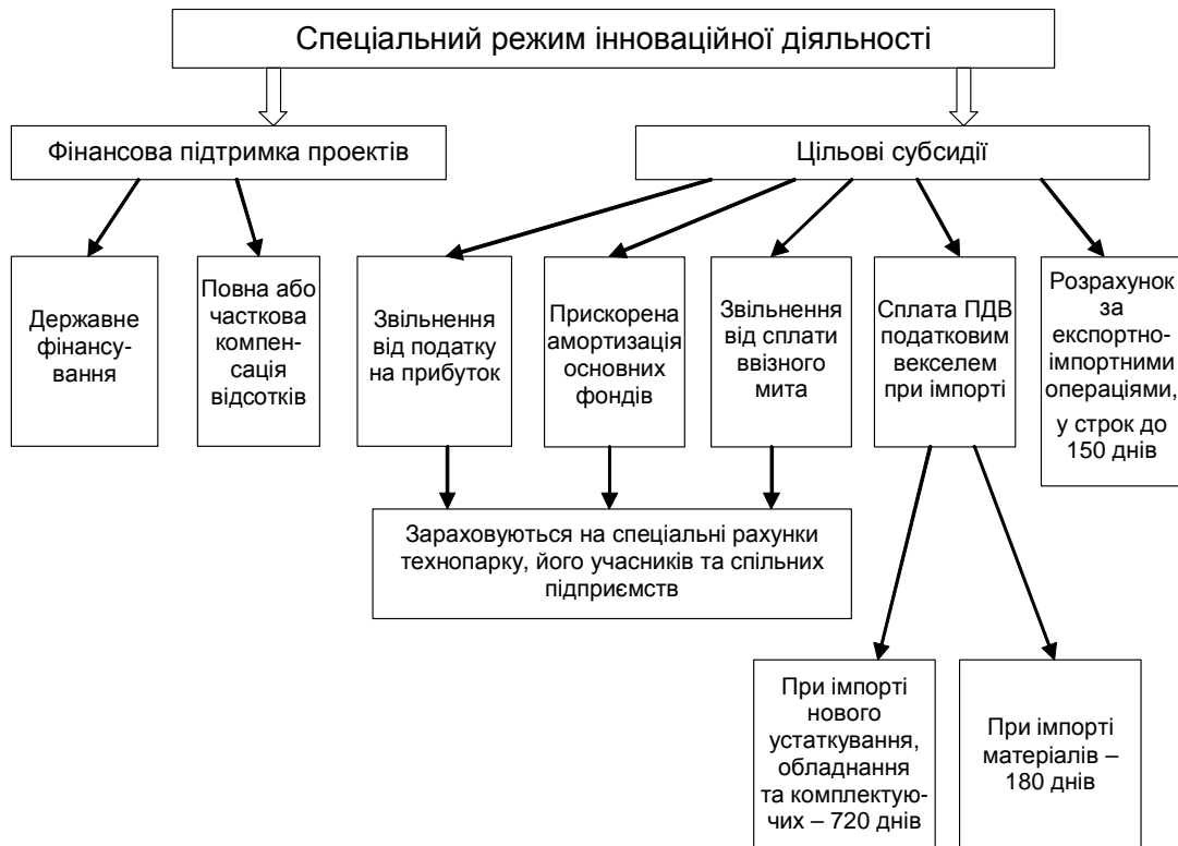
Рис. 2. Схема спеціального режиму інноваційної діяльності

оподаткування, від 2006 р. спостерігається тенденція до зниження обсягу залучених інвестицій (у тому числі іноземних). Так, у 2006 р. залучено 730,5 млн. дол. США (з них іноземних – 252,3 млн. дол., або 34,5% залучених інвестицій), у 2007 р. – 559,6 млн. дол. (79,8 млн. дол., або 14,3%), у 2008 р. – 406,3 млн. дол. (31,8 млн. дол., або 8%), у 2009 р. – 119,2 млн. дол. США. Скоротилася також кількість створених та збережених робочих місць (61,4 тис. створених та 106,1 тис. збережених до 2005 р.; 24,6 тис. створено та 21,4 тис. збережено з 2006 р.). Саме відсутність суттєвої державної підтримки інноваційних проектів технопарків призвела до скорочення проектів з 55 в 2003 р. до 11 в 2011 р. та практичної зупинки на сьогодні роботи із започаткування нових проектів технопарків. Реалізація частини зареєстрованих проектів зупинена в зв'язку з відсутністю необхідних для цього джерел фінансування.