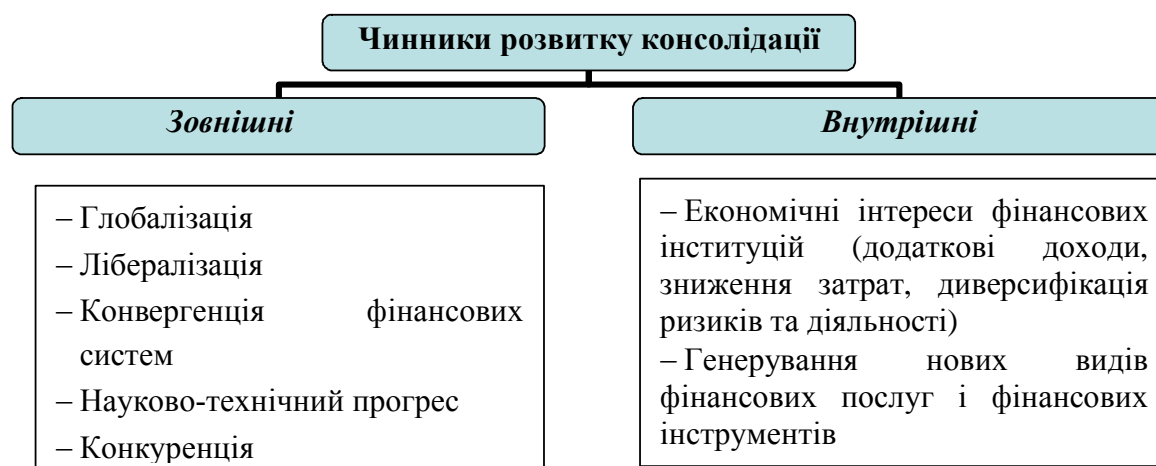
Рис. 1. Чинники розвитку консолідації банківського та страхового бізнесу*