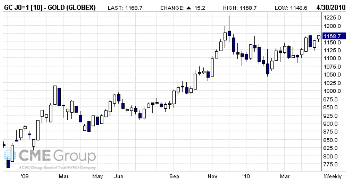
Рис. 1. Графік змін цін на ф'ючерсний контракт з поставкою в квітні 2010 р.

Не дивлячись на прогнози світових експертів щодо наступного різкого зниження вартості золота, девальвація валют світу та біржові проблеми демонструють протилежний ефект – зростання цін на золоті ф'ючерси.