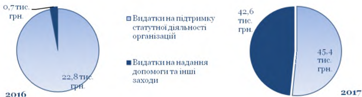
Рис. 2. Фінансування статутної діяльності громадських організацій у складі видатків обласного бюджету на регіональну цільову програму «Турбота» у I півріччі 2016-2017 рр., тис. грн.

У складі видатків на виконання програми «Турбота» на фінансування статутної діяльності організацій інвалідів за I півріччя 2016 року було виділено 22,8 тис. грн., або понад 97,0% сукупного обсягу. У 2017 році на ці ж потреби було виділено 45,4 тис. грн., або більше половини обсягу фінансування цієї програми (рис. 2).