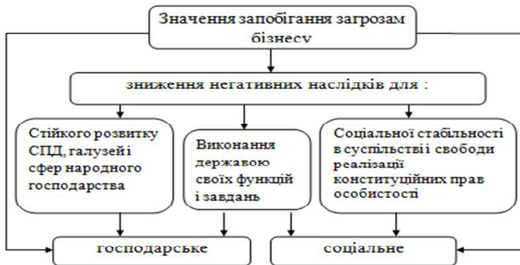
Рис.1.1. Принциповий зміст характеристики соціального і господарського значення запобігання загрозам бізнесу.

На рис. 1.1. представлено підхід до визначення соціального та господарського значення запобігання загрозам бізнесу у вигляді трьох аспектів життєдіяльності суспільства: держави, особистості і самого бізнесу.