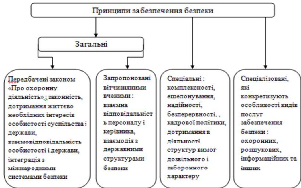
Мал. 3.1 Принципи забезпечення безпеки

В результаті вивчення законодавчих основ безпеки і публікацій сучасних вчених складається думка, що сукупність принципів забезпечення безпеки доцільно поділяти на три групи: загальні, спеціальні і спеціалізовані (рис.3.1.).