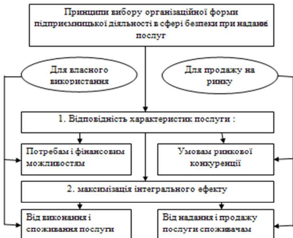
Рис. 3.2. Принципи вибору організаційної форми підприємницької діяльності в сфері безпеки

Вибір організаційної форми підприємницької діяльності являє собою непросте методичне рішення, що потребує відповідного апарату. В якості такого апарату пропонується методика, що базується на зіставленні інтегрального економічного ефекту розглянутих варіантів, в основі якої лежать такі принципи (рис.3.1).