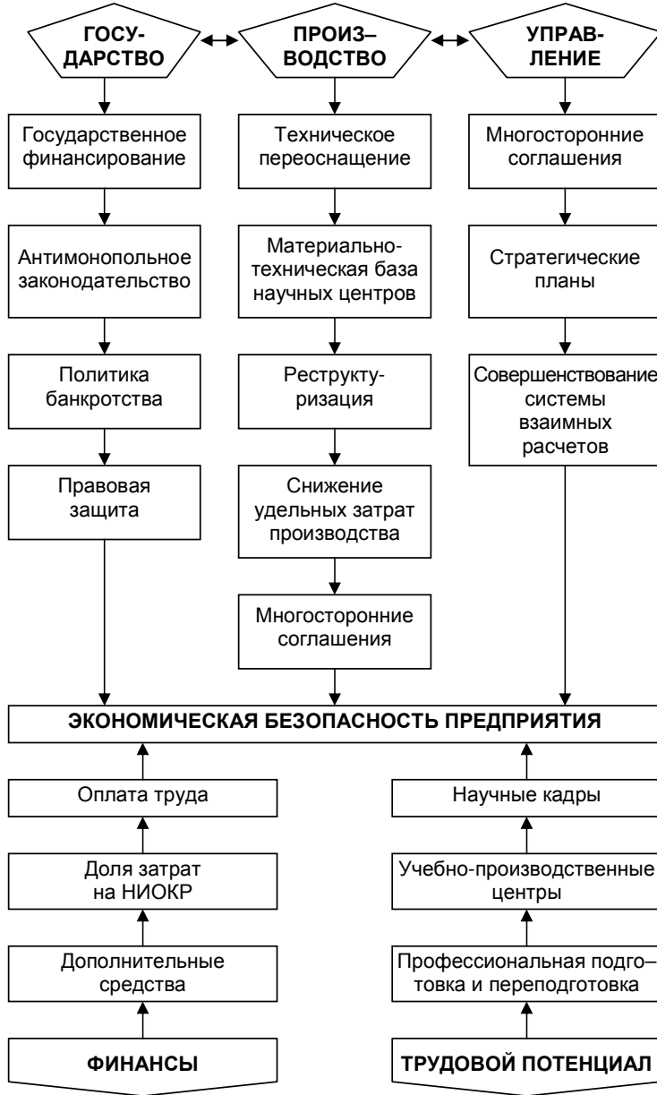
Схема взаимодействия показателей, влияющих на уровень экономической безопасности предприятия