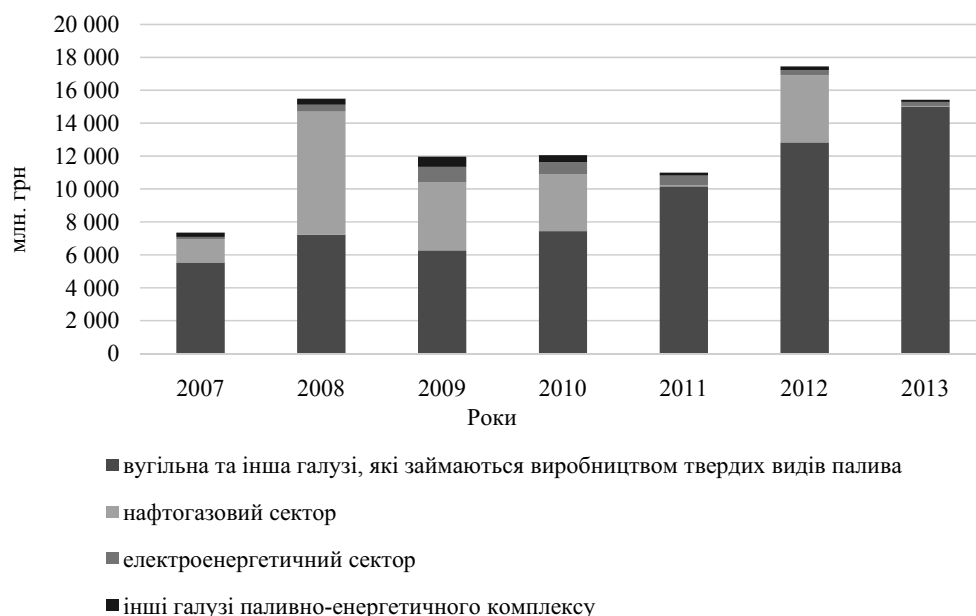
Рис. 2. Бюджетні видатки на підтримку економічної діяльності ПЕК*