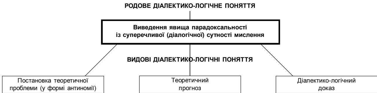
Рис. 1. Структурна модель парадоксального мислення

“постановка теоретичної проблеми у формі антиномії”, “теоретичний прогноз” та “діалектико-логічний доказ”. Графічно структурна модель парадоксального мислення може мати такий вигляд (рис. 1).