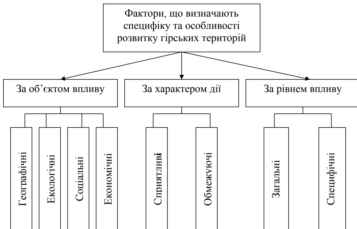
Рис. 1.3. Класифікація факторів, що визначають специфіку та особливості розвитку гірських територій

та іншими особливостями життя горян, пов'язаними з їх ізольованістю від рівнинних територій. Однак значну роль відіграють фактори, специфічно регіональні, обумовлені загальним рівнем розвитку країни, де розміщені гірські райони, станом соціально-економічного розвитку конкретних територій, екологічної ситуації в регіоні. Тому за рівнем впливу фактори поділені на загальні та специфічні.