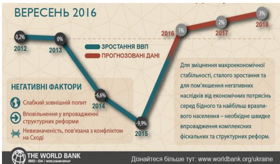
Рис.2.2. Макроекономічний аналіз України (вересень 2016)

Вони скоротилися з 9.6% ВВП у 2015 році до 5.5% у 2016, що значно нижче, ніж видатки на пенсії, які становлять 10.8% ВВП. Це призвело до утворення дефіциту пенсійного фонду на рівні близько 5% ВВП, що наразі є одним з основних фіскальних ризиків. З другого боку, інші податкові надходження перевищили очікування завдяки зростанню економічної активності у 2016 році. Так, надходження від податку на додану вартість, податку на доходи фізичних осіб та податку на прибуток підприємств зросли на 7.6%, 13.1% та 25.7% відповідно у реальному вимірі.