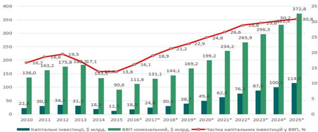
Рис.2.3. Капітальні інвестиції та ВВП

Прогноз зростання економіки залишається помірним через значні зовнішні та внутрішні виклики, однак прискорення реформ може допомогти забезпечити вищі темпи зростання у майбутньому. Процес впровадження реформ залишається повільним в умовах складного політичного середовища. На додачу, конфлікт на сході України загострився з кінця січня 2017 року. Припинення торгівлі з невідконтрольними територіями Донецького регіону матиме негативний вплив на два такі важливі сектори, як металургія та виробництво електроенергії. З іншого боку, окреслився певний прогрес у низці ключових реформ.