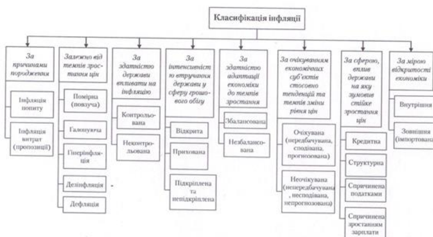
Рис.1.1 Класифікація інфляції за різними ознаками.