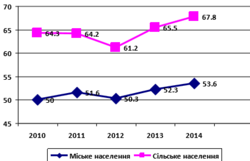
Рис. 2.1. Рівень витрат на продукти харчування у структурі споживчих витрат (на базі коефіцієнта Енгеля), % [4]

Розрахуємо цей показник для населення України на основі даних за 2010 - 2014 років.