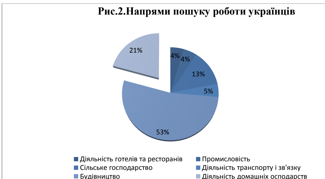
Рис.2.Напрями пошуку роботи українців

Міграція українців у пошуках роботи – є проблемою системного характеру. Сьогодні європейський ринок вимагає більше трудових мігрантів, але проблема легалізації та отримання робочого місця закордоном ще більше ускладнилося. З іншого боку, близькість до України дозволяє створювати спільні підприємства в прикордонних районах із залученням місцевої робочої сили. Це слід враховувати при плануванні і розподілі продуктивних сил в регіоні. За даними представництва ООН в Україні, кожен п'ятий український мігрант хотів би покинути своє попереднє місце проживання, а особливо якщо це стосується сільського поселення. У той же час, з частини тих, хто прийняв таке рішення, лише 15% змінили своє місце проживання в межах країни, а 5% залишили державу взагалі. На рис. 2.показані напрями пошуку роботи українців за кордоном [9]