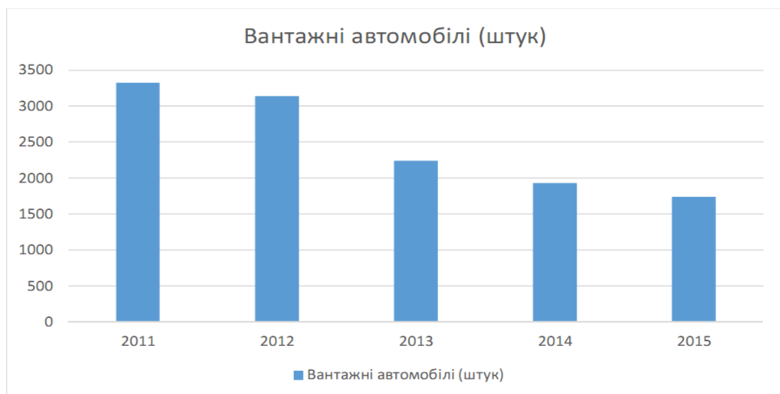
Рис. 1. Динаміка виробництва в Україні вантажних автомобілів [7].

Ринок вантажних автомобілів в цілому за останні роки в Україні почав динамічно зростати. Якщо брати до уваги купівлю грузових машин у 2016 році, за даними асоціації «Укравтопром» було продано 8354 машин (+62%). Лідирує компанія Renault з показником 1684 од. ( у 2015 – 1003 од., +68%). На другому місці – Fiat (1044 од.) На третьому місці знаходиться російський ГАЗ – 930 (569 од., +63%) [1]. Починаючи з 2013-2014 років через економічну кризу сектор вантажних перевезень зазнав падіння (на 5,1%). Цей процес прискорився ще за результатами початку 2015 року. Аналізуючи динаміку будівництва вантажних автомобілів за 2011-2015 роки (рис. 1), можна зазначити постійний щорічний спад виробництва. Якщо у 2011 р. виготовлено 3331 вантажівку, то у 2015 р. лише 1741. За 5 років фактично у двічі зменшилось виробництво. Це зумовлено економічною кризою, тимчасовою окупацією Криму та проведенням антитерористичної операції на сході України.