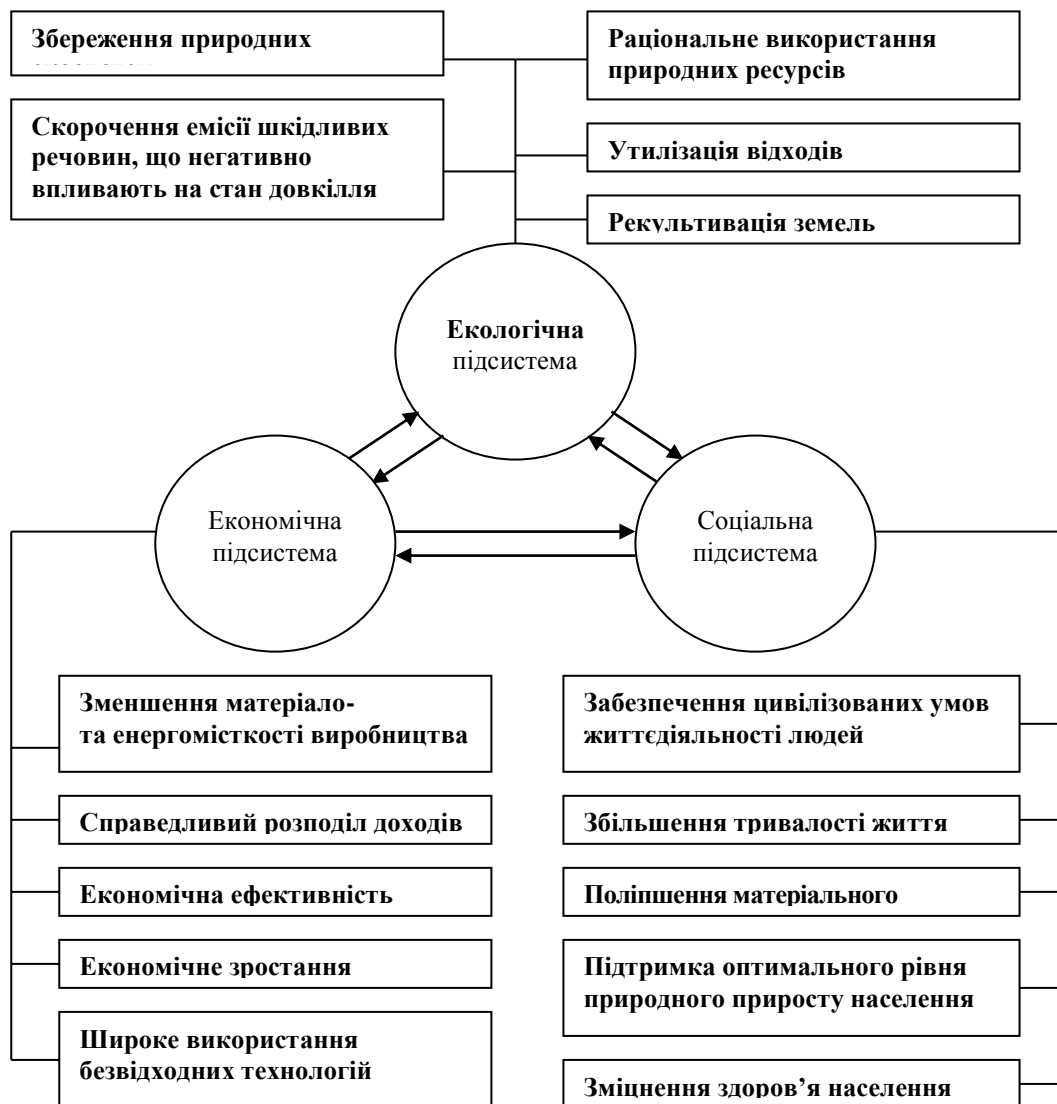
Рис. 1. Структурна схема елементів регіональної соціально-еколого-економічної системи в умовах сталого розвитку

держав чи їх об'єднань, але й на рівні адміністративно-територіальних одиниць різного рівня, населених пунктів чи окремих громад. Оскільки більшість глобальних соціально-економічних та екологічних проблем за специфікою виникнення та методами вирішення вважаються такими, що мають переважно регіональний характер, а кожному регіону властиві специфічні природно-екологічні та соціально-економічні умови, в роботі запропоновано розглядати будь-який регіон як соціально-еколого-економічну систему, яка має власну мету розвитку, здатна до самоорганізації і це знаходить відображення у характері її розвитку. В роботі дана характеристика екологічної, економічної та соціальної підсистем та обґрунтована структурна схема їх взаємодії в умовах сталого розвитку (рис. 1).