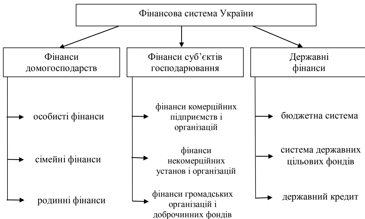
Рис. 1. Склад фінансової системи України (за внутрішньою будовою)

Відмінності між фінансами домогосподарств, фінансами суб'єктів господарювання та державними фінансами полягають передусім у складі та структурі їхніх доходів і витрат, методах формування доходів і здійснення (фінансування) витрат, характері регламентації та рівні усупільнення (індивідуалізації) цих процесів, а також специфіці прийняття управлінських рішень у кожній із сфер фінансової системи. З урахуванням специфіки формування та особливостей управління бюджетом у складі фінансів домогосподарств рекомендовано виокремлювати такі ланки: особисті фінанси (якщо домогосподарство складається з однієї людини, яка має власне джерело доходу і самостійно формує свої витрати); сімейні фінанси (якщо домогосподарство представлене однією сім'єю, яка формує єдиний спільний бюджет); родинні фінанси (якщо це розширене домогосподарство, до складу котрого входять кілька сімей, кожна з яких має відокремлений бюджет або один спільний і кілька відокремлених бюджетів).