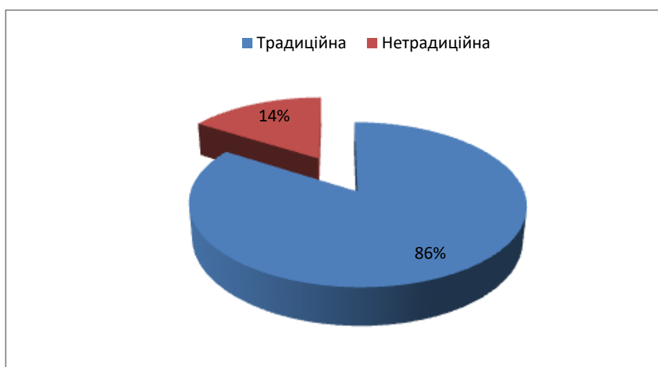
Рис. 2.2. Структура світового енергетичного ринку, частки

Частки такого ринку в числовому виразі показано на рис 2.2.