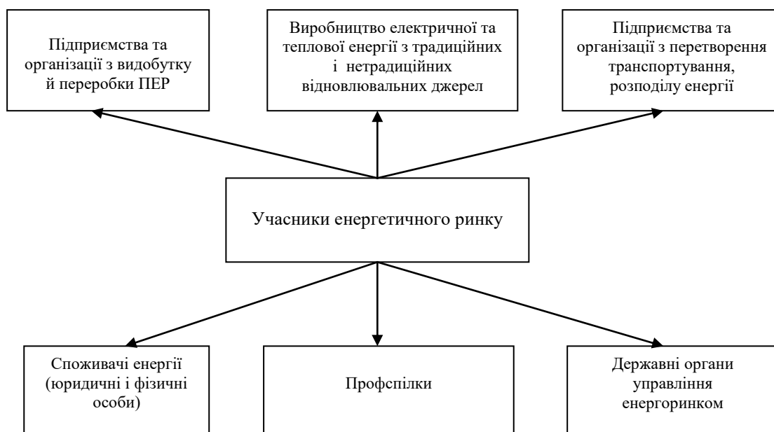
Рис. 1.1. Групи учасників енергетичного ринку

товари й надають послуги, що забезпечують процес виробництва енергії (наприклад, основні фонди енергетики тощо).