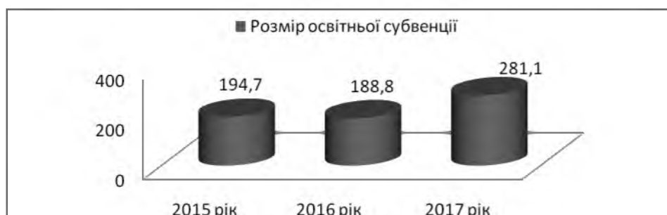
Рис. 1. Обсяг освітньої субвенції протягом 2015–2017 рр., млн. грн.*

Розмір освітньої субвенції у бюджеті м. Тернополя в 2017 р. складає 281 110 800 грн. та становить 42% від загальних видатків на освіту. А в 2015 р. її розмір становив – 194,7 млн. грн. та у 2016 р. – 188,8 млн. грн., що відповідно становить 52% та 38% від загальних видатків на освіту (рис.1).