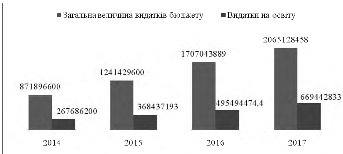
Рис. 2. Динаміка видатків бюджету м. Тернополя на освіту у 2014–2017 рр., грн.*