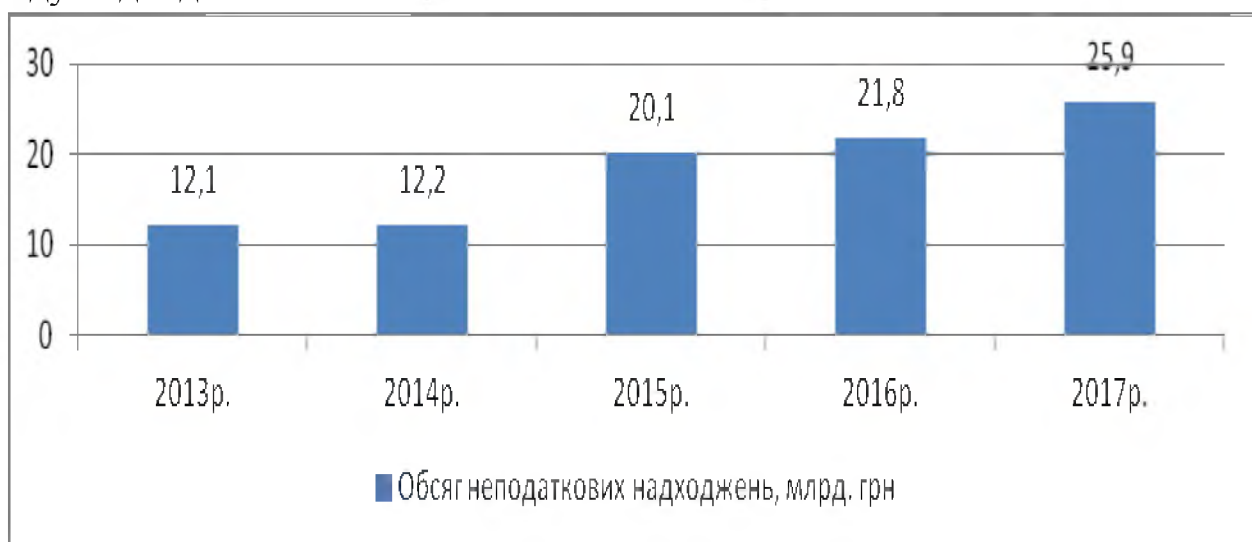
Рис 1. Обсяг неподаткових надходжень місцевих бюджетів України за 2013-2017 рр., млрд. грн.*

Проаналізуємо яке місце у системі доходів місцевих бюджетів посідають неподаткові надходження. Для цього розглянемо статистичні дані за останні 5 років. Це дасть змогу об'єктивно оцінити роль даного виду надходжень і виявити наявні можливості їх збільшення.