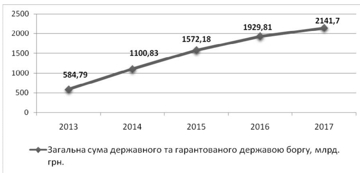
Рис. 2.2. – Динаміка державного та гарантованого державою боргу

Проте останній розрахований підсумковий показник державного і гарантованого державою боргу в гривневому еквіваленті, а саме показник 2017 року, повністю відповідає встановленим межам згідно з державним бюджетом України на 2017 рік у розмірі 2,296 трлн грн.