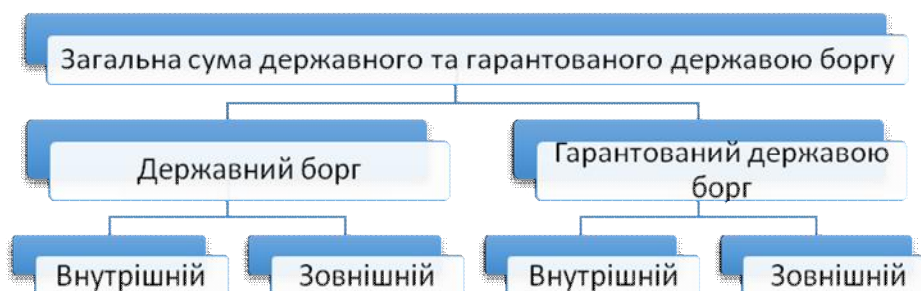
Рис. 2.1. Структура державного та гарантованого державою боргу згідно офіційних матеріалів МФУ*

Тому, доцільно провести аналіз показників структури державного та гарантованого державою боргу, згідно класифікації в офіційних документах Міністерства Фінансів України, яка відображена на рисунку 2.1..