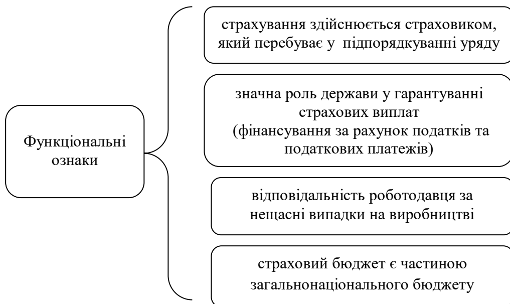
Рис. 2. Особливості моделі соціального страхування від нещасних випадків на виробництві за В. Беверіджем.*

Для Великобританії характерною є наявність великої кількості судових спорів стосовно визнання вини роботодавця. Це, в свою чергу, створює додаткові витрати, які можуть сягати до 50% від розміру компенсаційних виплат. Відмінною рисою моделі Беверіджа є те, що у ній відсутнє обмеження відповідальності роботодавця. Отож, підсумовуючи особливості соціального страхування від професійних ризиків на виробництві у Великобританії виділимо характерні особливості моделі Беверіджа (рис.2.).