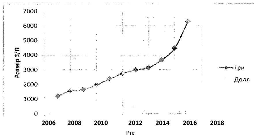
Рис. 1. Динаміка середньої заробітної плати в Україні, 2007-2017 роки Примітка: побудовано на основі[1;11]

Проаналізувавши динаміку середньої заробітної плати в Україні за 2007 - 2017 роки (рис.1), можна побачити що впродовж 2007 - 2009 рр. номінальна заробітна плата зростала, але реальна почала падати. Далі з 2010 по 2013 рік заробітна плата в Україні почала стрімко зростати, у 2010 вона складала 1982 гривні, тобто 249 доларів, а вже в 2013 році вона склала - 2979 гривень (373 дол. США), що свідчить про суттєве покращення загального добробуту українців на той час. Проте така тенденція протрималася не довго, і у зв'язку з військово- політичними подіями, які відбулися в Україні у 2014 році, та безпосередньо через стрімку інфляцію національної валюти у доларовому еквіваленті - рівень середньої заробітної плати почав стрімко падати. За період 2013 - 2015 рр. реальна заробітна палата знизилася вдвічі - з 373 до 153 доларів, хоча номінально вона зросла. Така реальна ситуація вплинула на платоспроможність українців, та на їх міграційні настрої. Хоча в подальшому впродовж наступних двох років номінальна заробітна плата почала зростати, і в 2017 році склала 6273 гривень, що в 5 разів більше за середню зарплату у 2007 році, але реально за 10 років вона не зросла ( з 239 доларів впала до 224 дол. США).