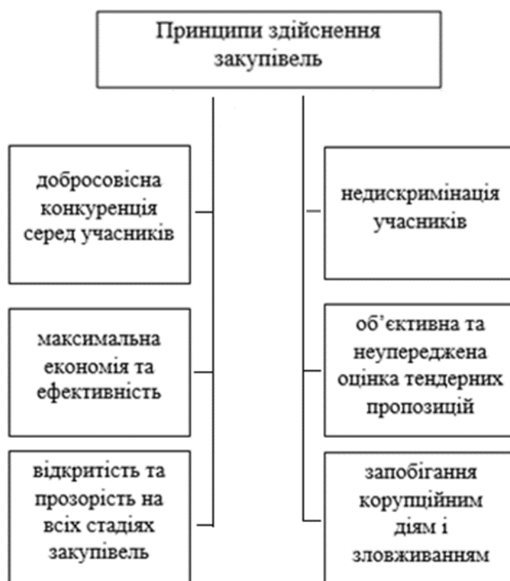
Рис. 1. Засадничі принципи організації закупівель. Джерело: [8]

підприємств з окремих сфер господарської діяльності та з 1 серпня 2016 року для всіх інших замовників. Отже, з цієї дати всі надпорогові закупівлі (тобто ті, вартість яких дорівнює або є більшою за вартість, що встановлена в абз. 2 та 3 ч. 1 ст. 2 Закону № 922; для послуг – 200 тисяч гривень, робіт – 1,5 мільйона гривень) мають здійснюватись через електронну систему закупівель. Порядок проведення надпорогових закупівель регламентується Законом № 922. Станом на 2016 рік було здійснено 366 тисяч закупівель на загальну суму у 274 млрд. гривень. З них 101 тисяча закупівель були надпороговими (22 тисячі проходили через ProZorro), 136 - допороговими, а ще по 128 тисячах у електронну систему були завантажені звіти. Загальна економія бюджетних коштів склала близько 10 млрд гривень. На Рис. 1 представлено засадничі принципи державних закупівель, що дають змогу досягнути прозорості та доброчесності.