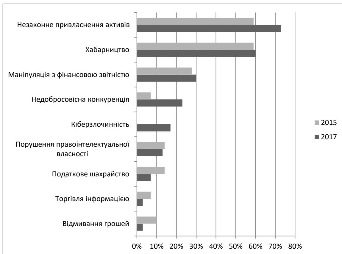
Рис. 3.2. Види шахрайства в Україні у 2015 та в 2017 роках