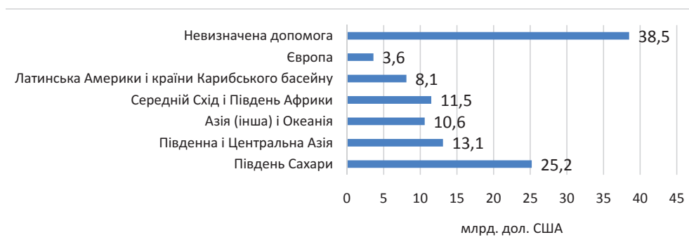
Рис. 2. Розподіл ОДР за регіонами за 2015–2016 рр. в середньому, млрд. дол. США [9]