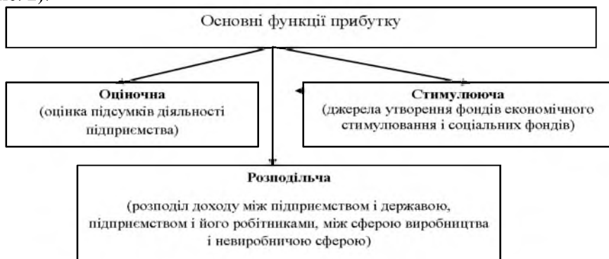
Рис. 2. Основні функції прибутку

Прибуток як одна із основних категорій товарного виробництва виконує ряд функцій: оціночна, стимулююча та розподільча функція (рис. 2).