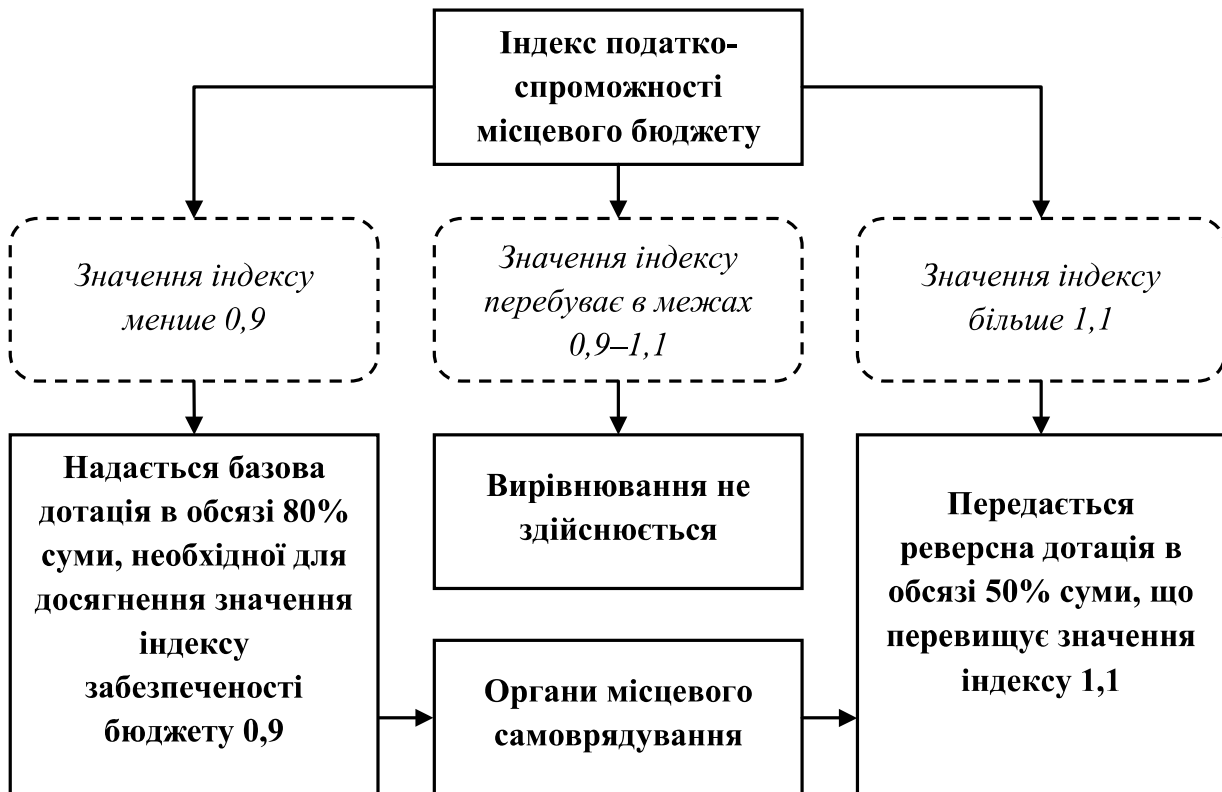
Рис. 2. Українська система фінансового вирівнювання територій*