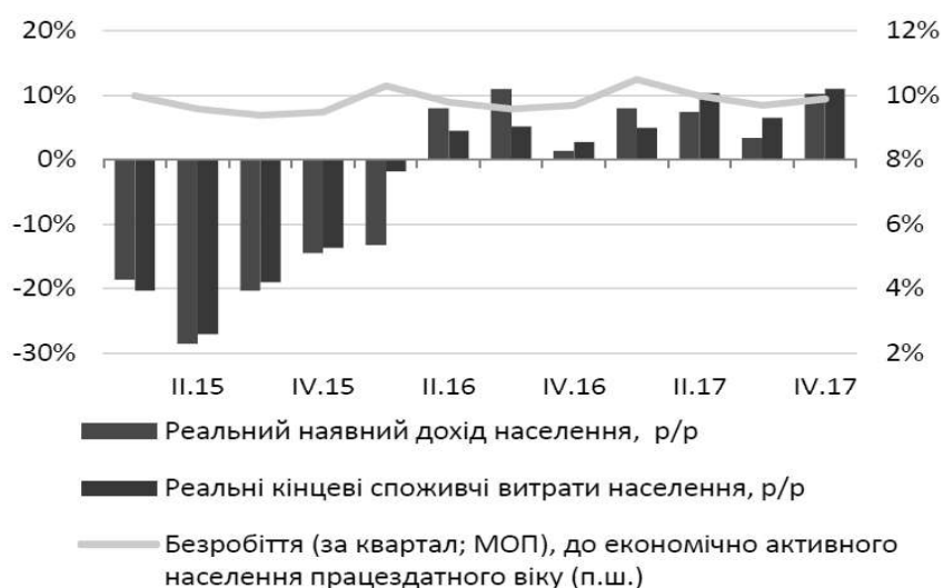
Рис. 1. Зміна реального наявного доходу, споживчих витрат населення та рівня безробіття у 2015-2017 рр. [2, с. 28]

Домінуючим джерелом доходів вітчизняних домогосподарств, які є складовою їх фінансових ресурсів, виступає заробітна плата (52,4%) та соціальні виплати, а саме: пенсії, стипендії, соціальні допомоги надані готівкою (20,2%).