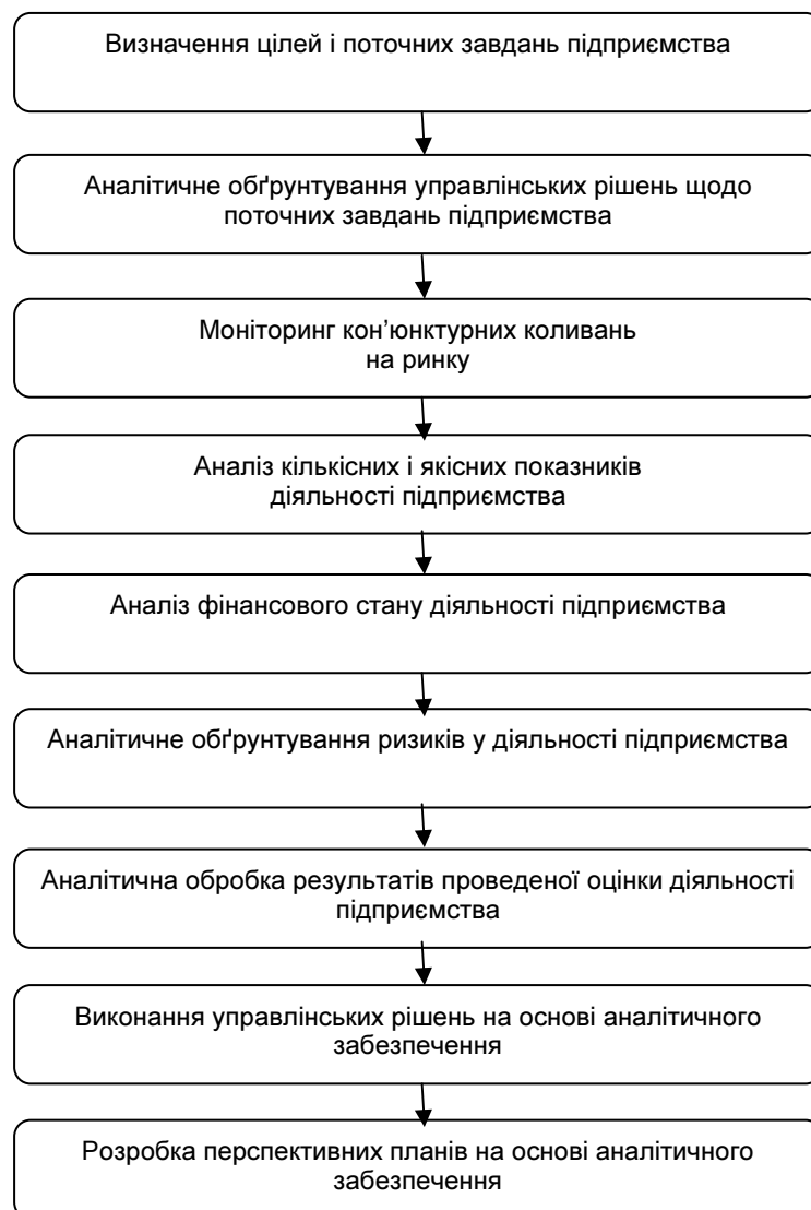
Рис. 2. Етапи аналітичного забезпечення прийняття та реалізації управлінських рішень

Багатоаспектність і важливість організації аналітичного забезпечення зумовлює виділення її послідовності на етапах обґрунтування та реалізації управлінських рішень з відповідними напрямками економічного аналізу на підприємстві (рис. 2).